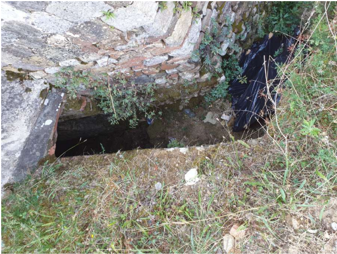
FOTOGRAFIA N. 17