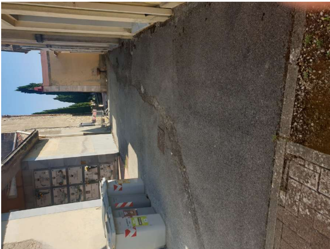
FOTOGRAFIA N. 1