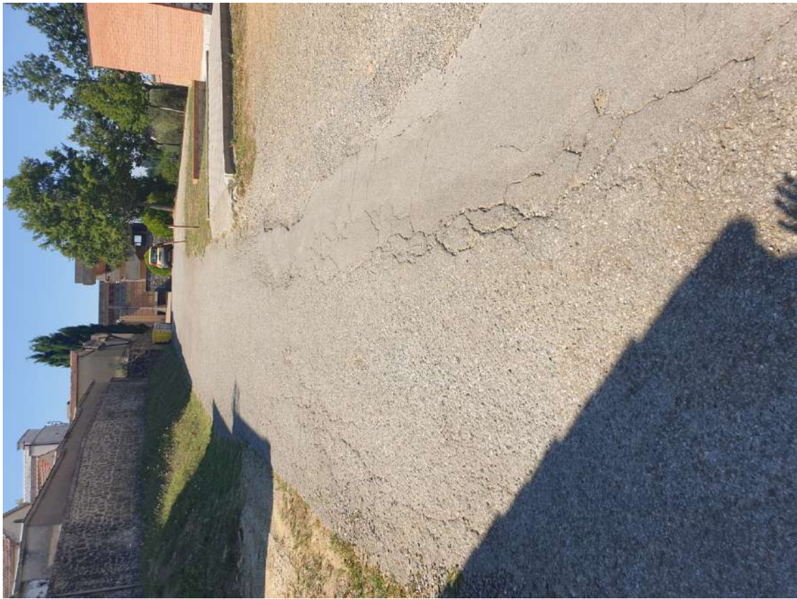
FOTOGRAFIA N. 5