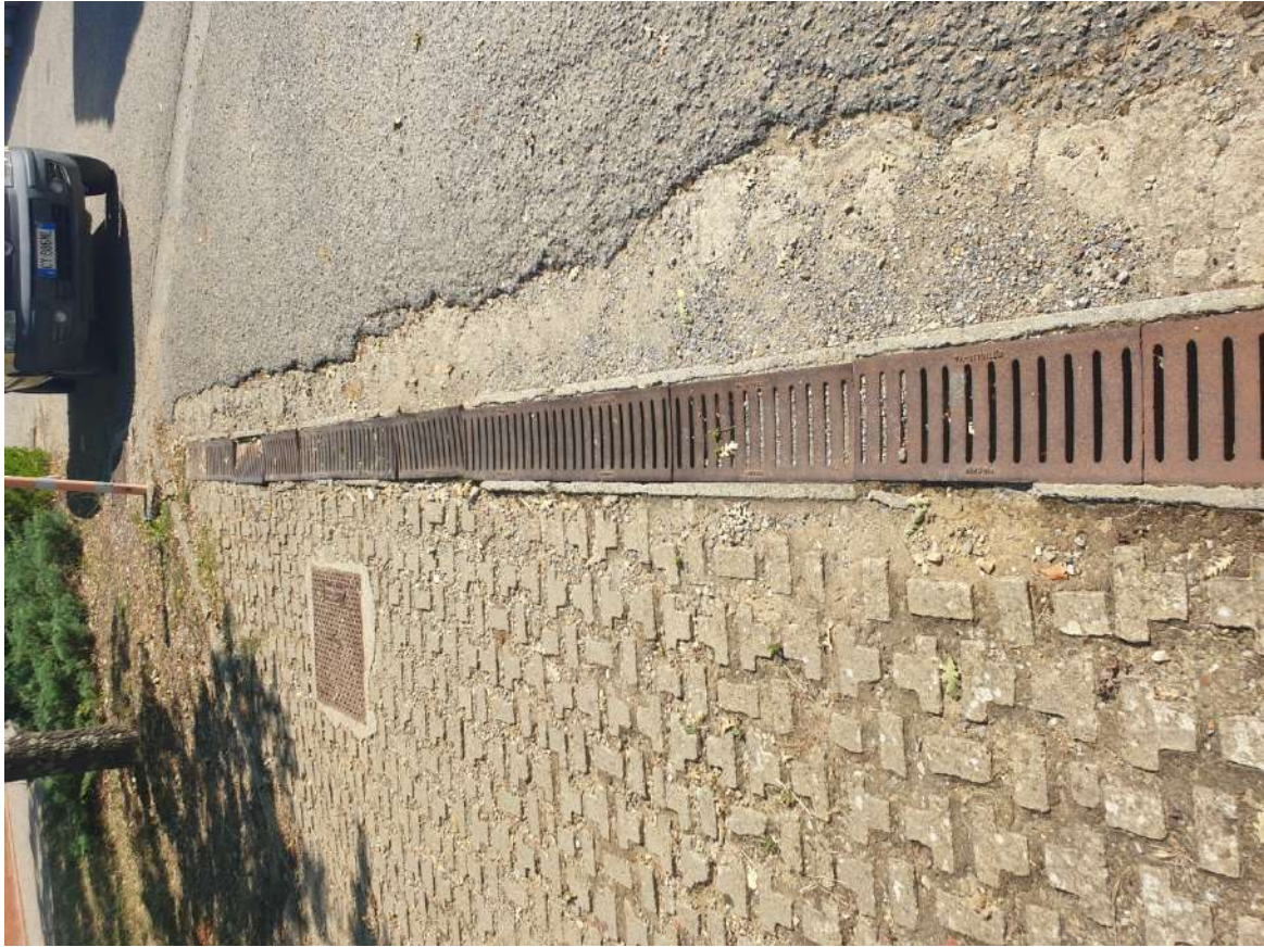
FOTOGRAFIA N. 9