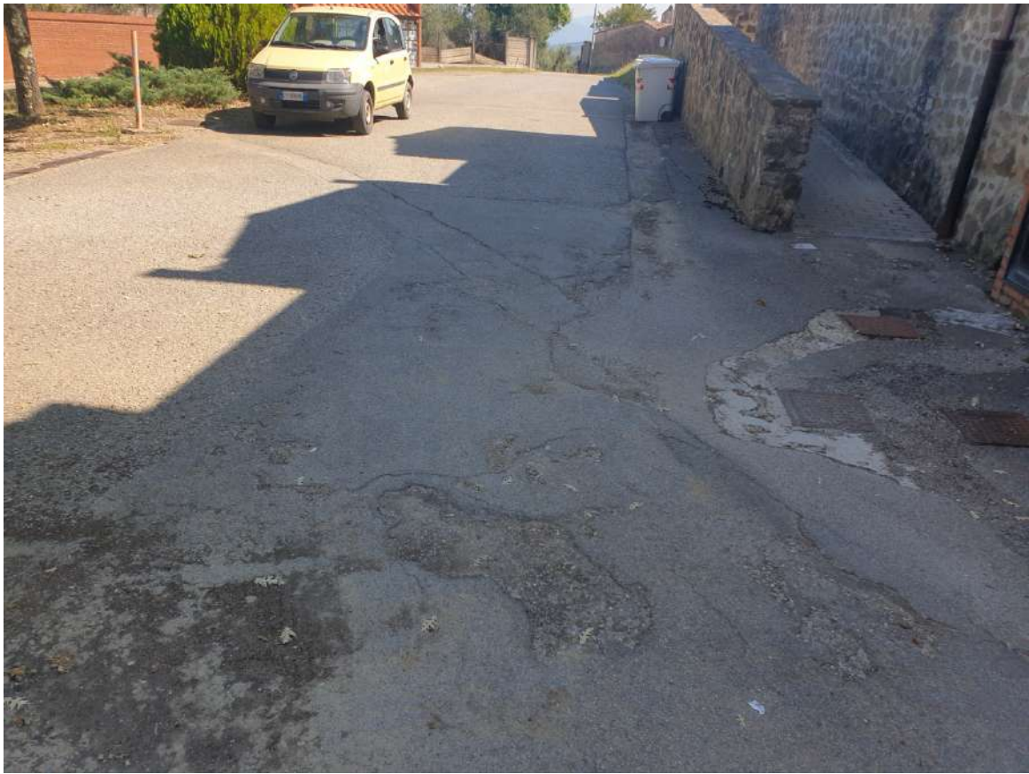
FOTOGRAFIA N. 7