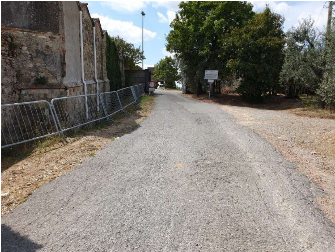
FOTOGRAFIA N. 19