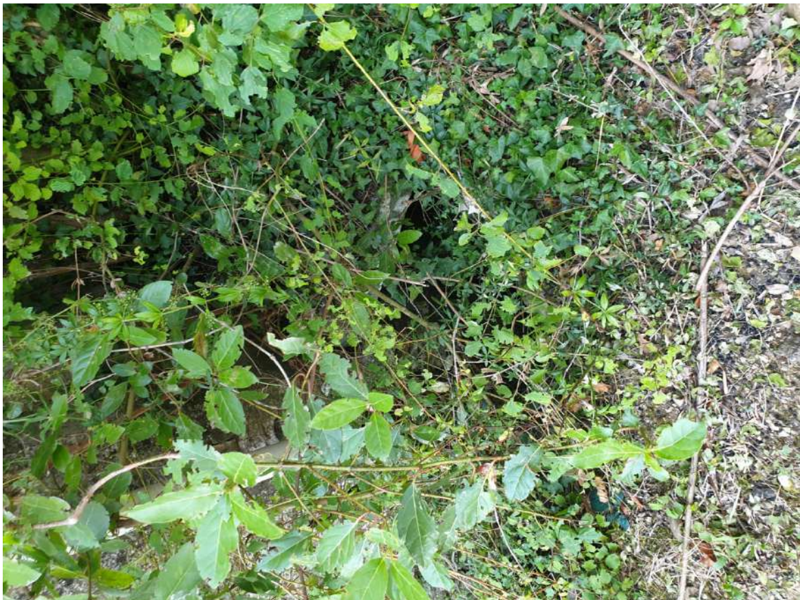
FOTOGRAFIA N. 14