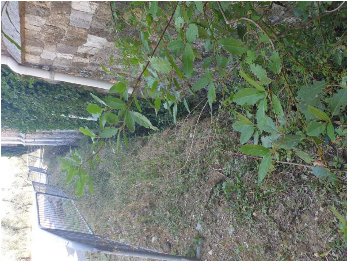
FOTOGRAFIA N. 15