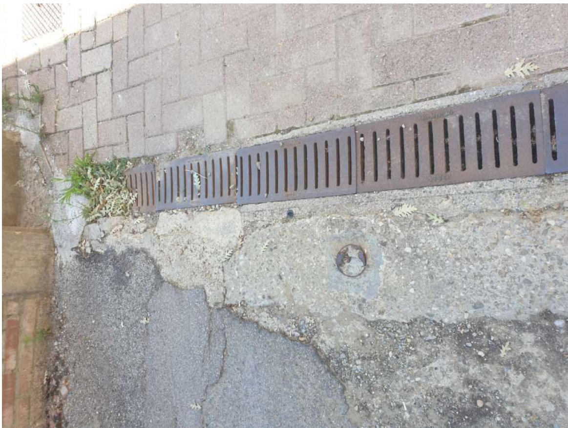
FOTOGRAFIA N. 8