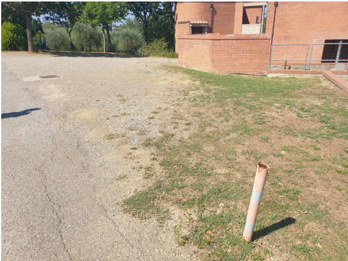
FOTOGRAFIA N. 10