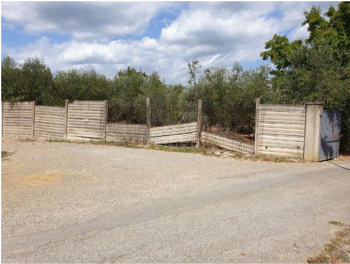
FOTOGRAFIA N. 13