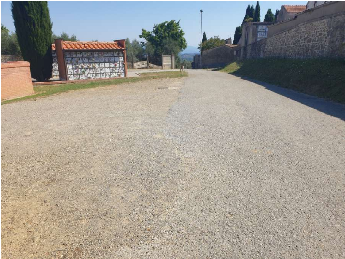
FOTOGRAFIA N. 6