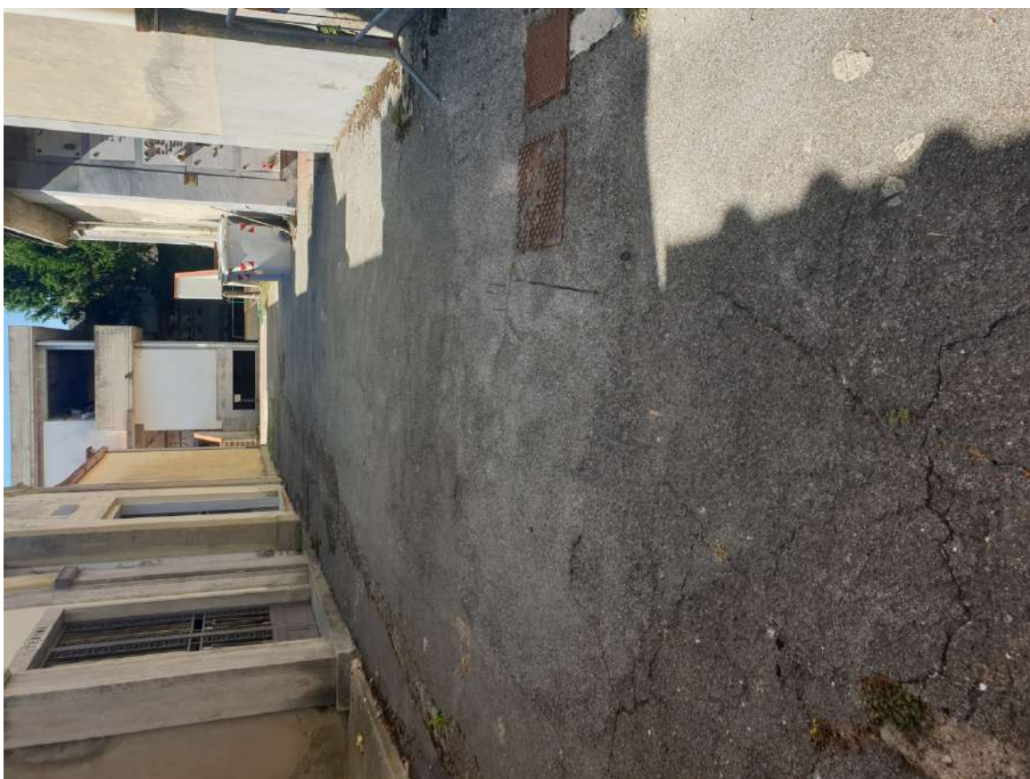
FOTOGRAFIA N. 2