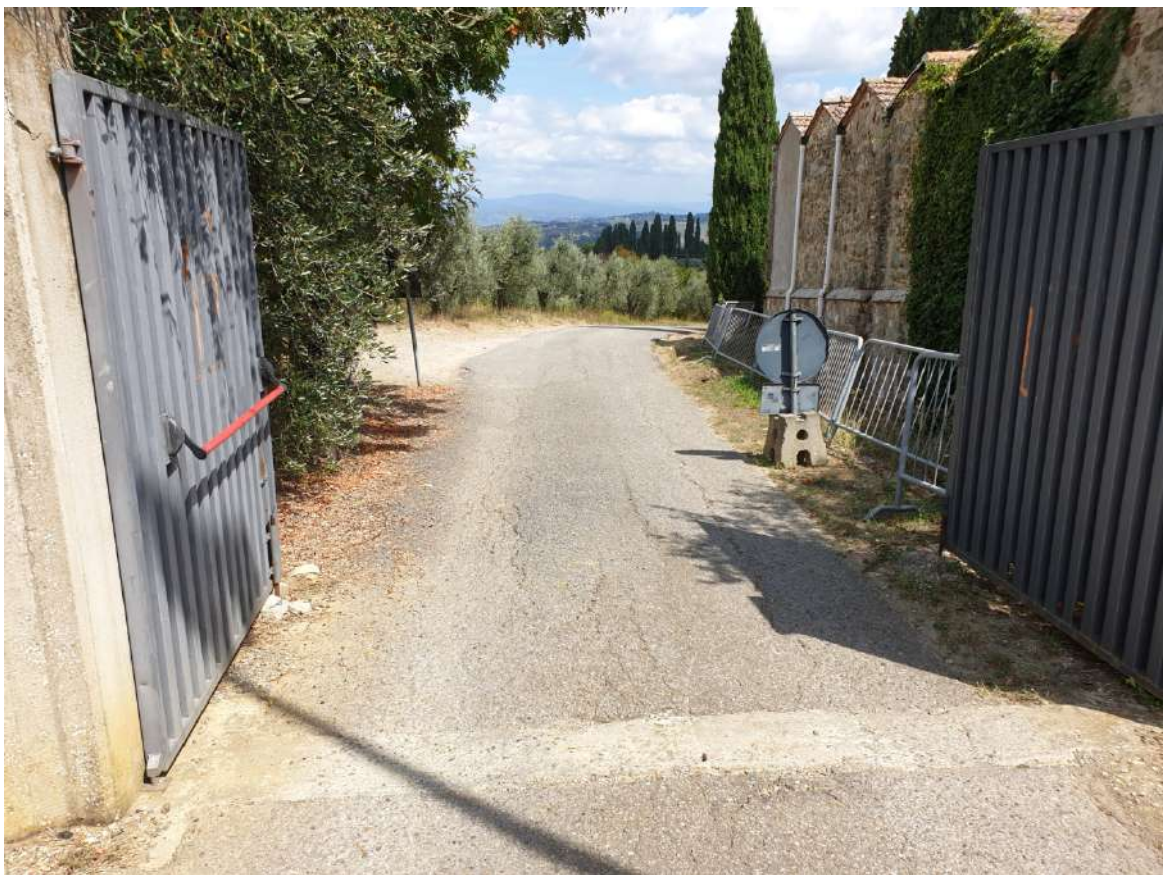
FOTOGRAFIA N. 18