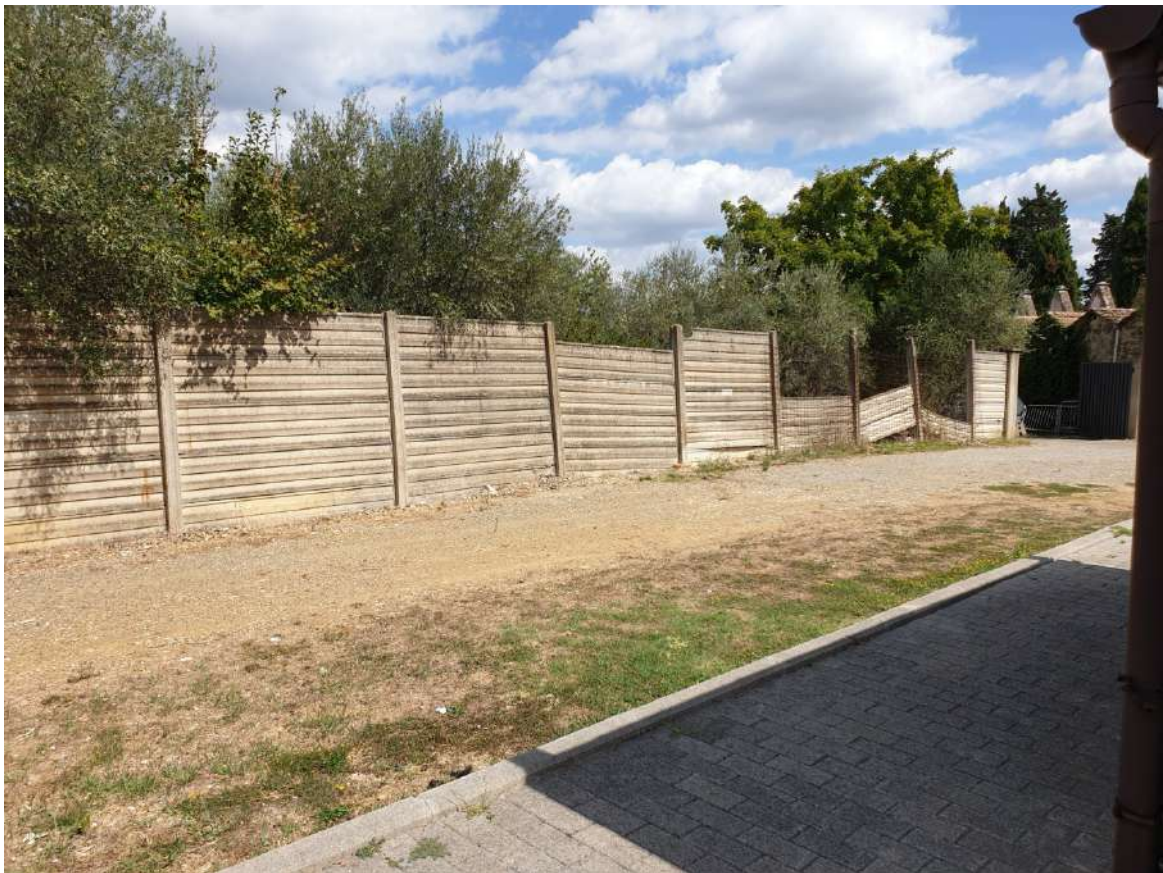
FOTOGRAFIA N. 12