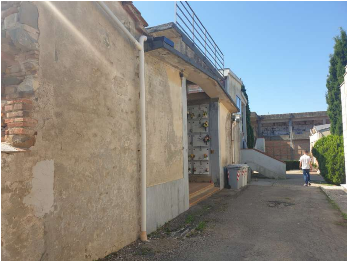
FOTOGRAFIA N. 3