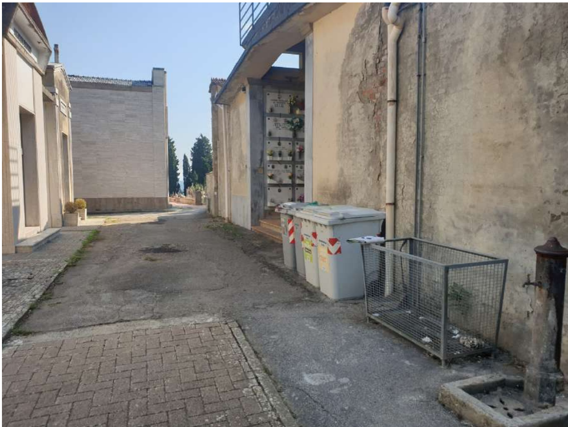
FOTOGRAFIA N. 4